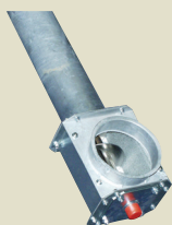
Lukket indløb med Ø-150 eller OK-160 flange.