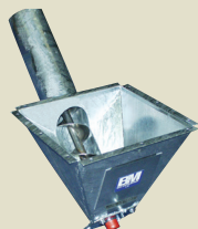
45° lukket indløb med 300x300 mm flange.

DET SIKRE VALG TIL LETTE OG VANSKELIGE MATERIALER